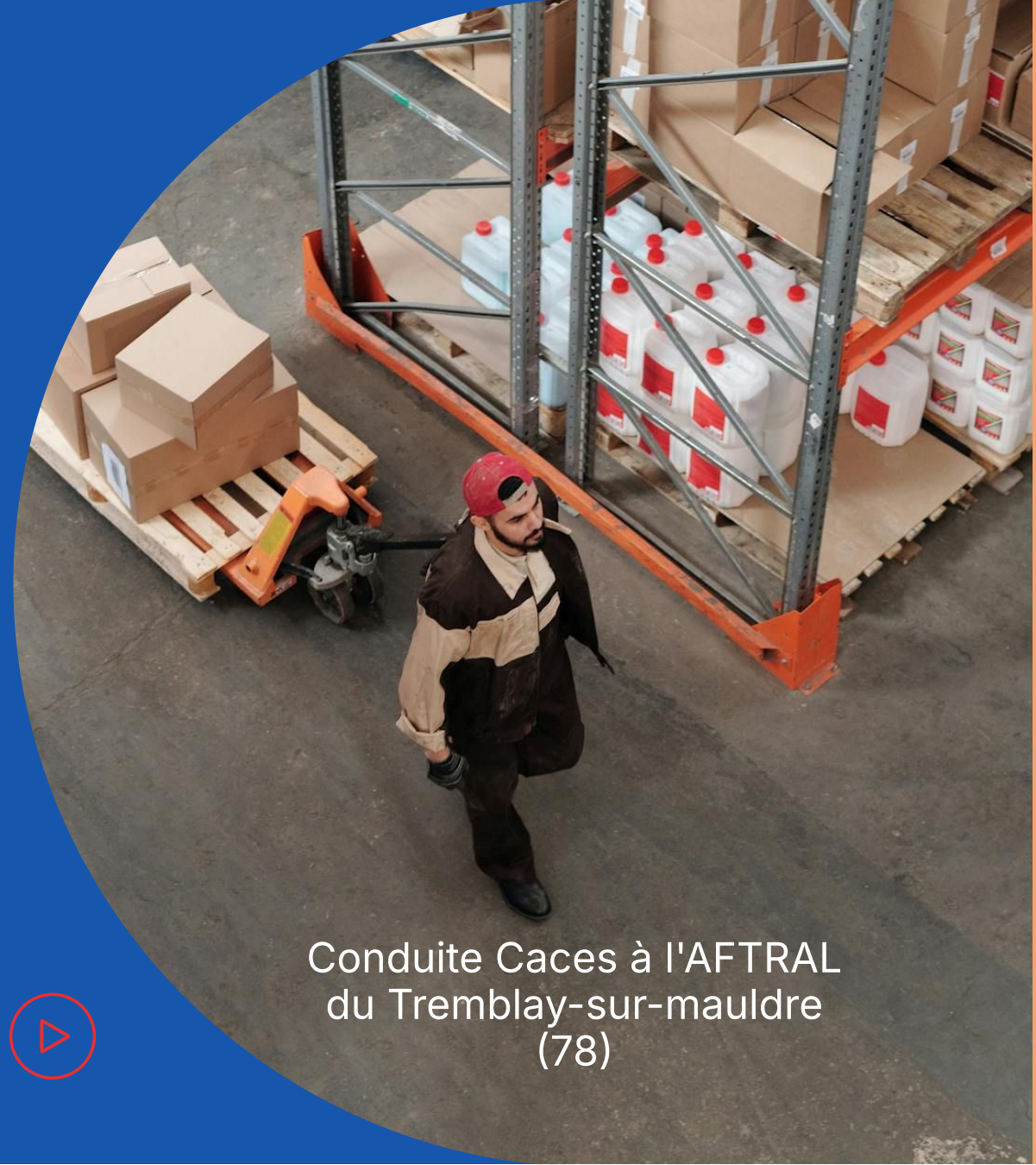
Conduite Caces à l'AFTRAL du Tremblay-sur-mauldre (78)